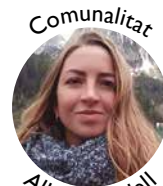
Comunalitat Alba Canadell