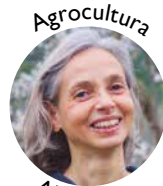
Agrocultura Alba Gros