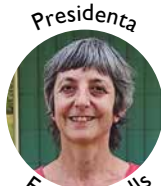
Presidenta Engràcia Valls