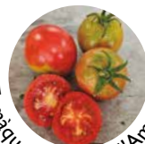
Tomàquet rosa de l'Ametlla