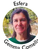
Esfera Gemma Comella