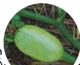
Carbassó antic de Menorca