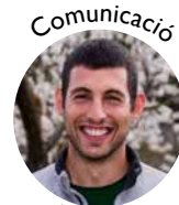
Comunicació Joan Sans