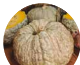
Carbassa del ferro