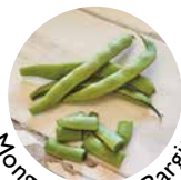
Mongeta de cal Bargit