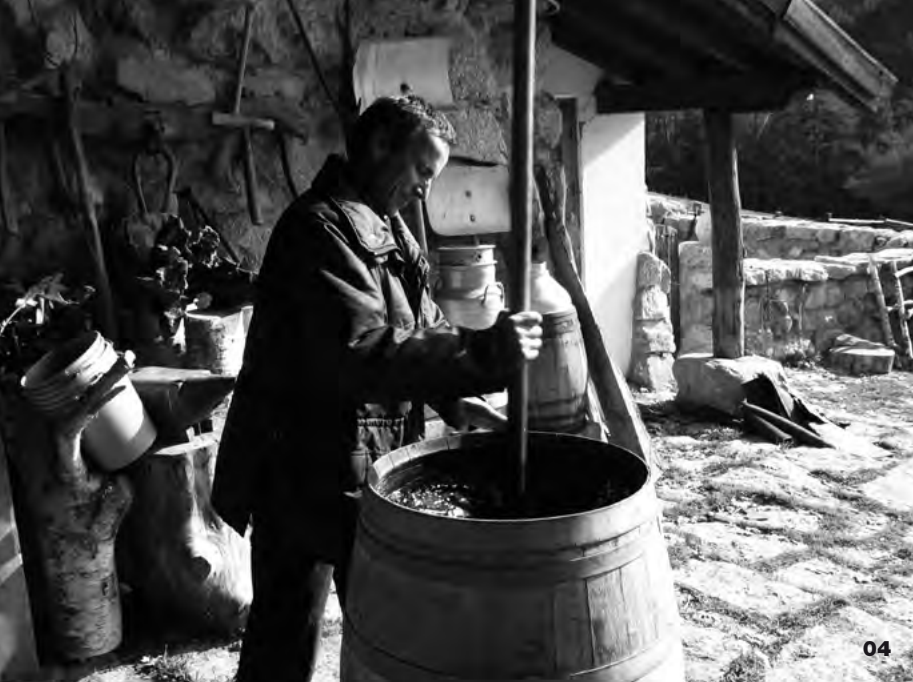
04. Dinamització dels preparats 500 i 501