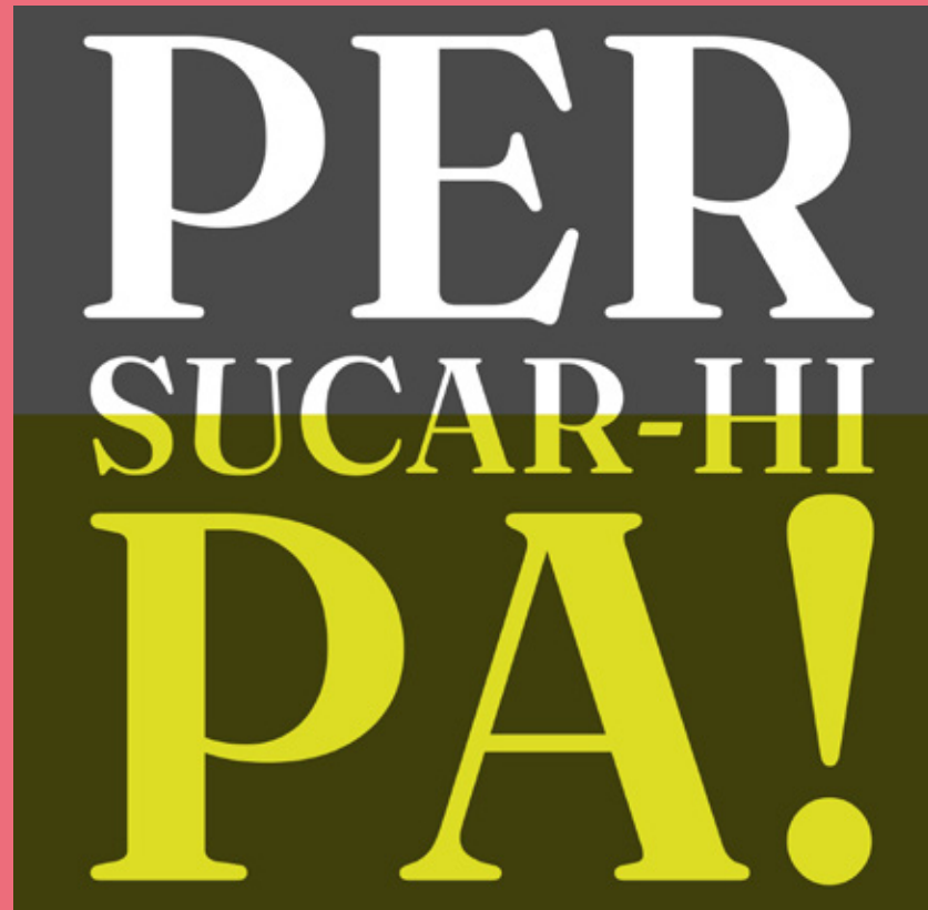
Portada llibre Per sucар-hi pa!