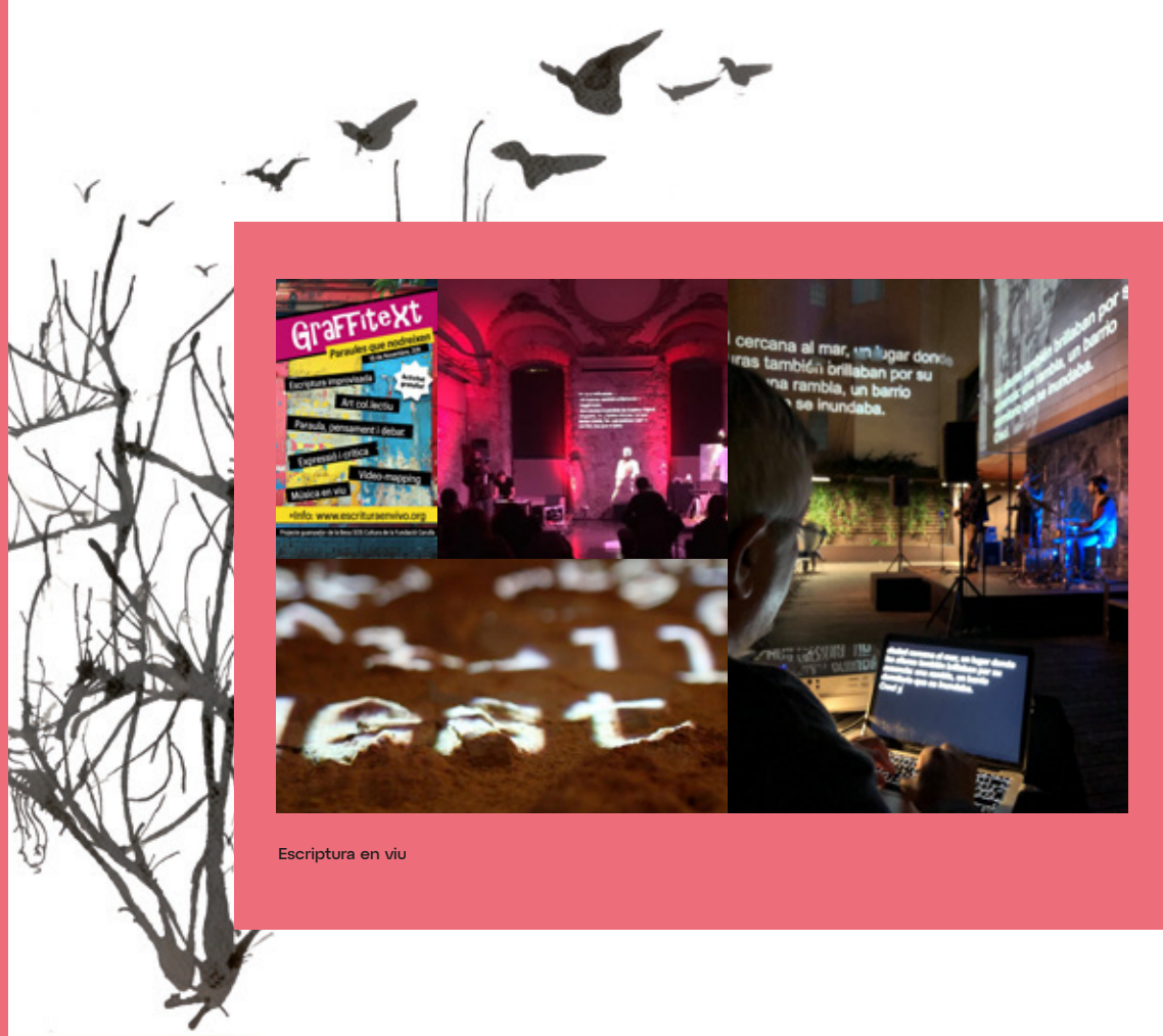
Escripura en viu

Organització: Centre Cultural el Casino i l'Associació Escripura en Viu Amb el suport de la Fundació Carulla