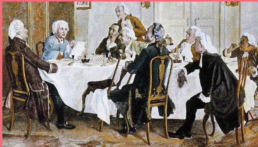
La sobretaula de Kant

Organització: Institut d'Estudis Catalans - Secció de Filosofia, Edicions Universitat de Barcelona, Grup de Professorat de Filosofia de la Catalunya Central i Òmnium Bages-Moianès