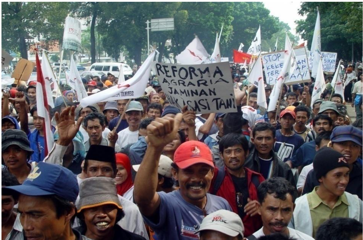
Protesta en pos de derechos agrarios en Indonesia

Mucha de estas conclusiones parecen obvias, pero dos cosas nos alarmaron. Una de ellas fue observar que la concentración de la tierra es un fenómeno mundial, incluso en aquellos países en que se supone que los programas de reforma agraria del siglo 20 habían acabado con ella. En muchos países, ahora mismo, está ocurriendo una contra-reforma, una especie de reforma agraria en reversa, ya sea la apropiación de tierras por las corporaciones en África, el reciente golpe de Estado en Paraguay impulsado por los empresarios agrícolas, la expansión masiva de las plantaciones de soya en América Latina, la apertura de Birmania a los inversionistas extranjeros o la expansión hacia el este de la Unión Europea y su modelo agrícola. En todos estos procesos, el control sobre la tierra le está siendo usurpado a los pequeños productores y sus familias por élites y poderes corporativos que están arrinconando a la gente en propiedades cada vez más pequeñas. La otra fuente de alarma fue darnos cuenta que actualmente las fincas campesinas