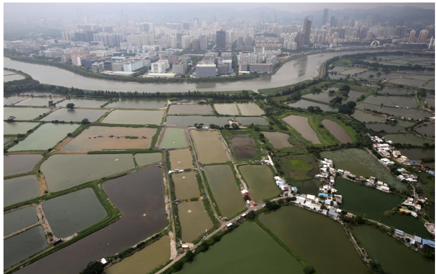
La ciudad de Shenzhen frente a tierras de cultivo

¿Qué es una pequeña finca? La superficie de tierra que ocupa no es el único parámetro significativo. Una finca de veinte hectáreas puede ser muy grande en India pero muy pequeña en Argentina. El acceso al riego, la fertilidad del suelo, el tipo de producción, el