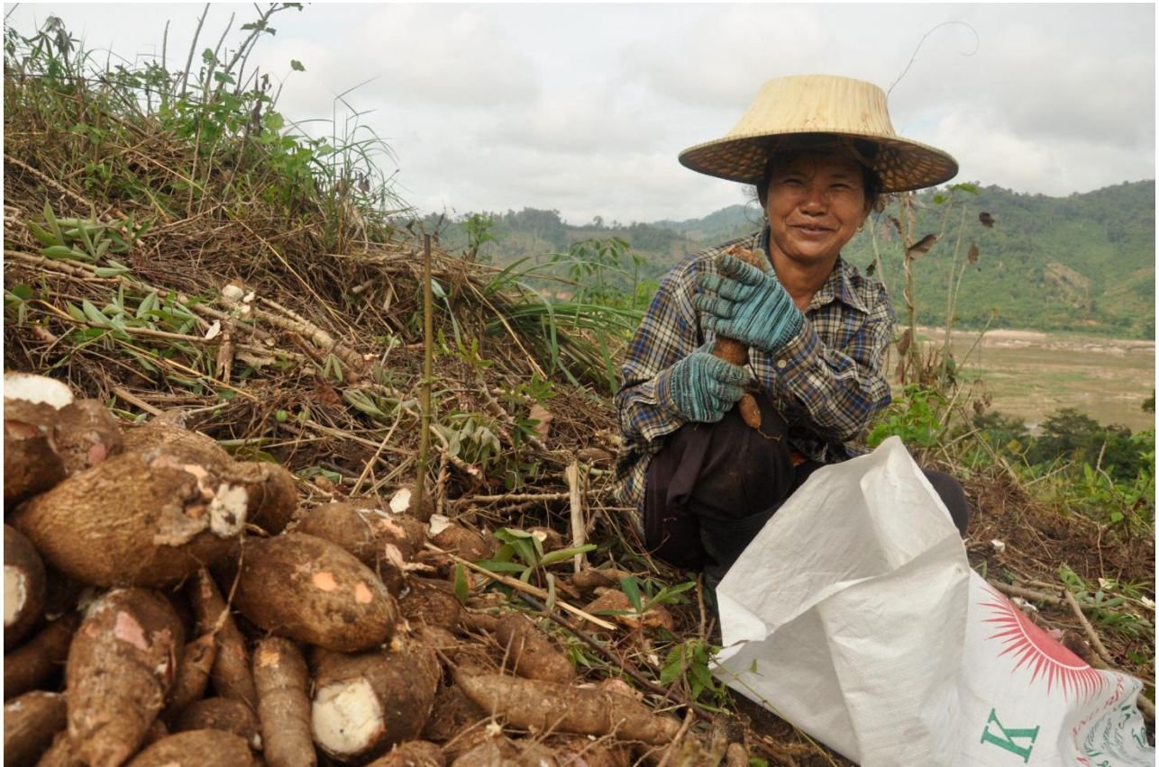
Cultivo de yuca en las orillas del Mekong: Las fincas campesinas tienden a darle prioridad a la producción de alimentos por encima de la producción de cultivos de materias primas o de exportación.

Ghana y Madagascar, las mujeres representan aproximadamente el 15% de los dueños de fincas, pero entregan el 52% de la fuerza de trabajo familiar y constituyen cerca del 48% de los asalariados agrícolas. 63 En Camboya, sólo el 20% de los propietarios agrícolas son mujeres, pero proveen 47% de la fuerza de trabajo agrícola remunerada y casi el 70% de la fuerza de trabajo en las fincas familiares. 64 En la República del Congo, las mujeres dan cuenta del 64% de toda la fuerza de trabajo agrícola y son responsables de alrededor del 70% de la producción de alimentos. 65 En Turkmenistán y Tajikistán, las mujeres representan el 53% de la población agrícola activa. 66 Existe muy poca información acerca de la evolución en la contribución de la mujer a la agricultura, pero su participación parece estar aumentando en la medida que las migraciones han dado lugar a que las mujeres y niñas asuman la mayor parte de la carga de trabajo de aquellos que se van. 67