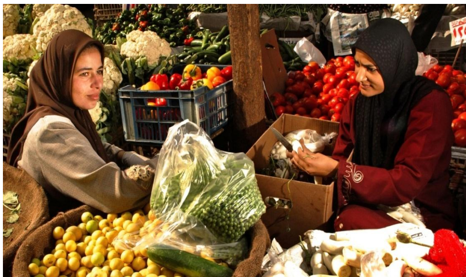
Mercado campesino en Turquía: el papel de mujer en la alimentación del mundo no se recoge de forma adecuada los datos oficiales ni en las herramientas estadísticas.

Si el proceso de concentración de la tierra continúa, no importará lo trabajadores, eficientes y productivos que sean, las familias y comunidades campesinas e indígenas no serán capaces de salir adelante. La concentración de las tierras agrícolas fértiles en menos y menos manos está directamente relacionada con el número creciente de personas que pasan hambre todos los días. Una reforma agraria genuina no sólo es necesaria, es urgente. Y debe ser llevada a cabo según las necesidades de las familias y comunidades campesinas e indígenas. Una de esas necesidades es que los territorios se reconstituyan y la tierra sea redistribuida a los pequeños agricultores como un bien inalienable, no como un activo comercial que se pierda si las familias y comunidades en el campo no son capaces de lidiar con las situaciones de gran discriminación a las que se enfrentan. Las comunidades agrícolas