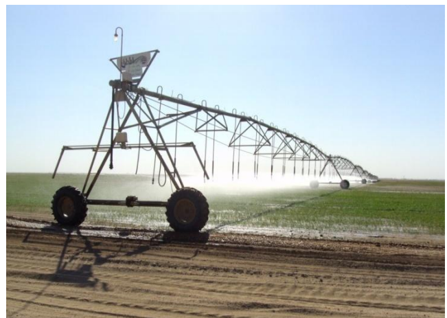
Riego por aspersión, Argelia

Finalmente, también omitimos en nuestros cálculos el reciente fenómeno de acaparamiento de tierras que está entregando, en manos de las grandes corporaciones, millones de hectáreas de tierras agrícolas fértiles y deprivando a decenas de miles de comunidades agrícolas de sus medios de subsistencia. El actual acaparamiento de tierras despegó recién en la última década y aún no ha sido registrado en las estadísticas oficiales.