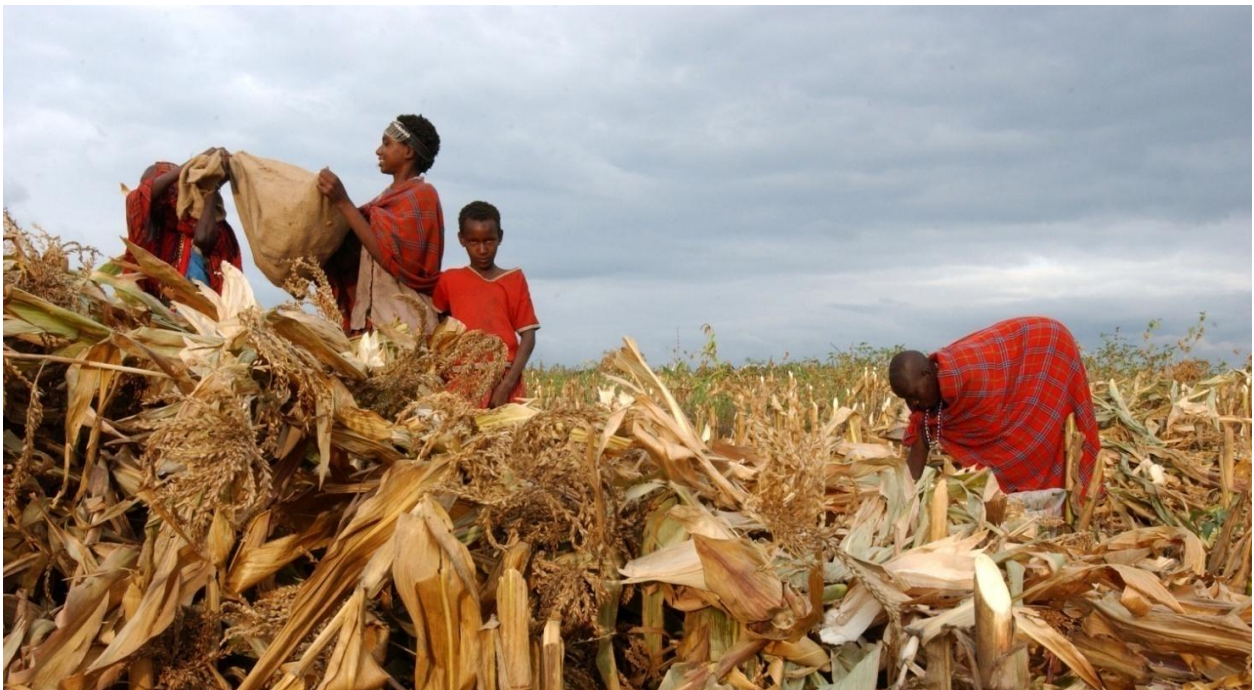
La cosecha de maíz en Narok, Kenia: si todas las fincas agrícolas del país tuvieran la misma productividad que actualmente tienen las fincas campesinas del país, se duplicaría la producción agrícola de Kenia.

Debido a un conjunto de fuerzas y factores tales como la concentración de la tierra, la presión demográfica o la falta de acceso a la tierra, la mayoría de las fincas pequeñas han ido reduciendo su tamaño con el tiempo. El tamaño promedio de las fincas se ha reducido en Asia y África. En India, el tamaño promedio de las fincas disminuyó más o menos a la mitad entre 1971 y 2006, aumentando al doble el número de fincas con una superficie menor a dos hectáreas. En China, la superficie promedio de tierra cultivada por familia cayó un 25% entre 1985 y 2000, y luego empezó a aumentar lentamente, debido al proceso de industrialización y concentración de la tierra.