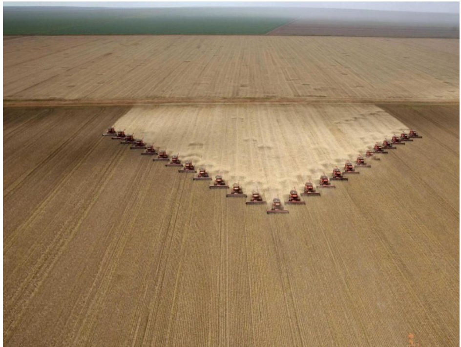
La principal preocupación de las grandes granjas corporativas, como esta plantación de soja, es el retorno de la inversión, que se maximiza con bajos niveles de gasto

mayor productividad que las pequeñas, esta diferencia es sólo marginal. 54 Esta tendencia está confirmada por numerosos estudios en otros países y regiones, todos los cuales