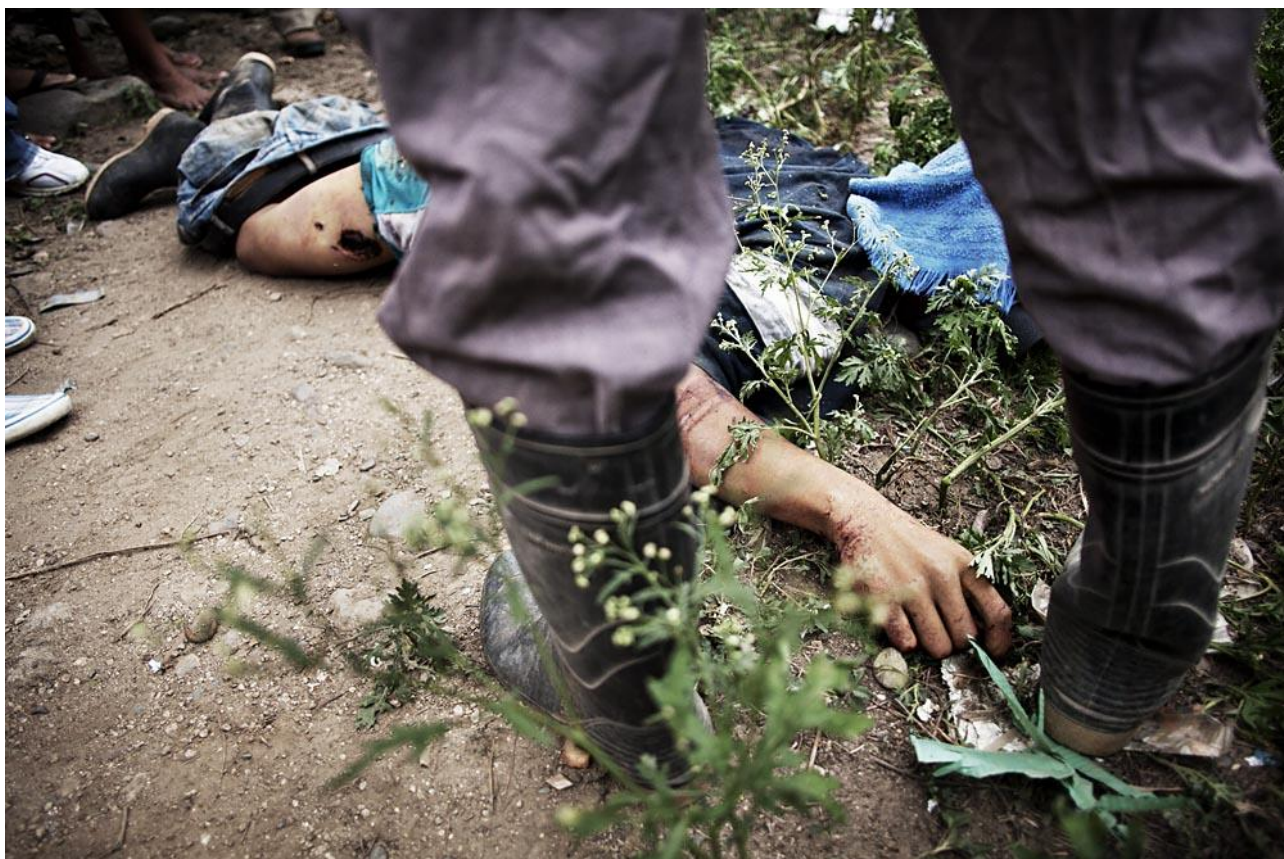
El asesinato de un campesino en el Bajo Aguán, Honduras

En relación a la producción de alimentos, escuchamos mensajes contradictorios. En los últimos años, más y más centros académicos y