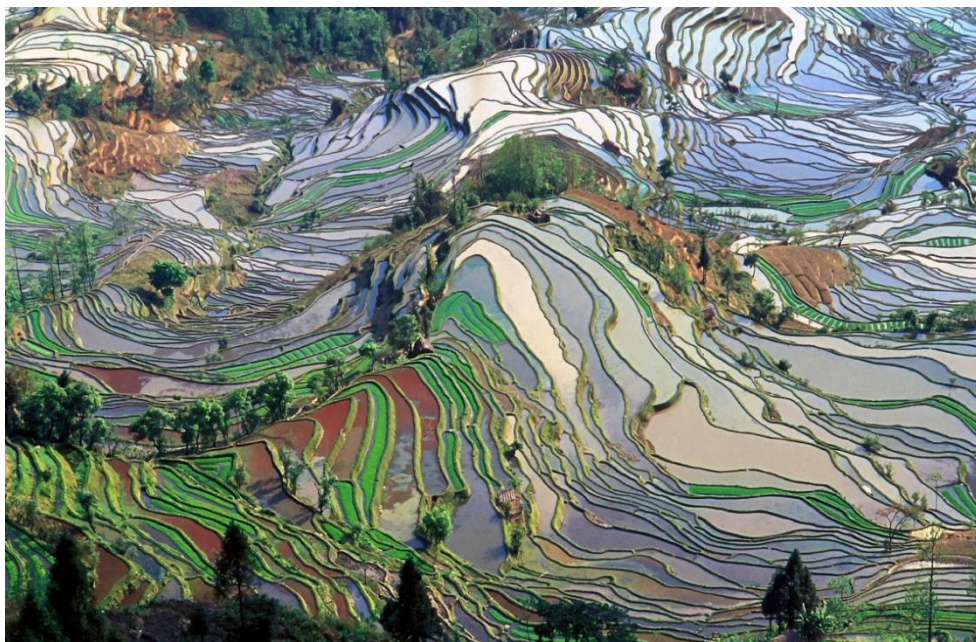
Terrazas de arroz en el condado de Yuanyang en China

Los agricultores y más aún los campesinos realizan un amplio rango de actividades bajo muy diversas formas. Estos incluyen manejo intensivo de cultivos hortícolas, rotación de cultivos con forrajeras anuales, sistemas de agrosilvicultura, cultivos itinerantes, crianza de ganado, piscicultura y pastoreo, o cualquier combinación de los anteriores.