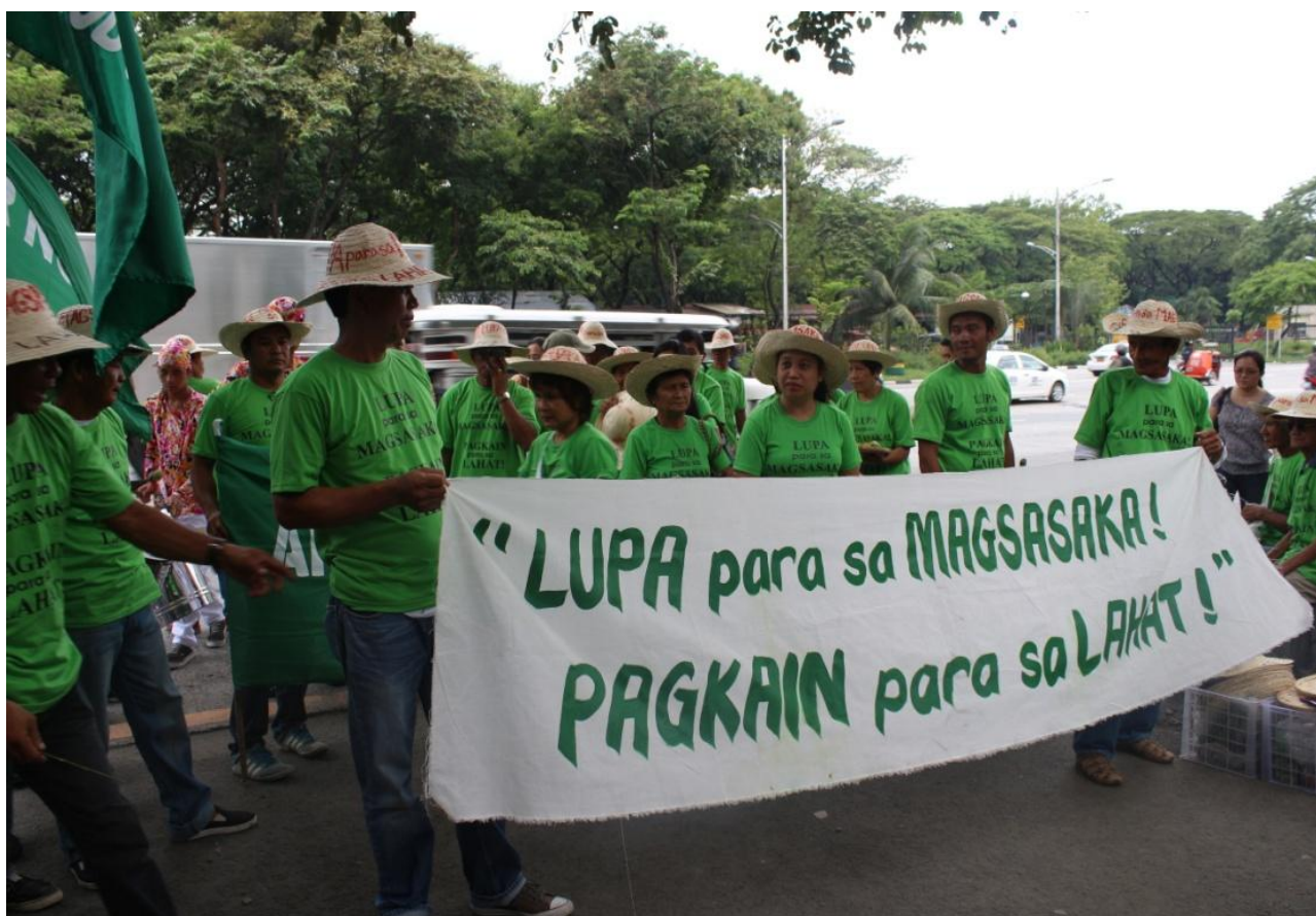
"¡La tierra para los campesinos! ¡Comida para todos!"

No hacer nada para cambiar esta situación alrededor del mundo, sería desastroso para todos nosotros. Los campesinos y pueblos indios—que son la gran mayoría de los que cultivan la tierra, que tienden a ser los más productivos y quienes producen actualmente la mayor parte del alimento en el mundo—están perdiendo la base misma de sus medios de subsistencia y de su existencia: la tierra. Si no hacemos algo, el mundo perderá su capacidad para alimentarse a sí mismo. El mensaje, entonces, es claro. Necesitamos, en forma urgente y a una escala nunca antes vista, revisar y relanzar programas de reforma agraria y reconstitución territorial genuinos que devuelvan la tierra a manos campesinas e indígenas.