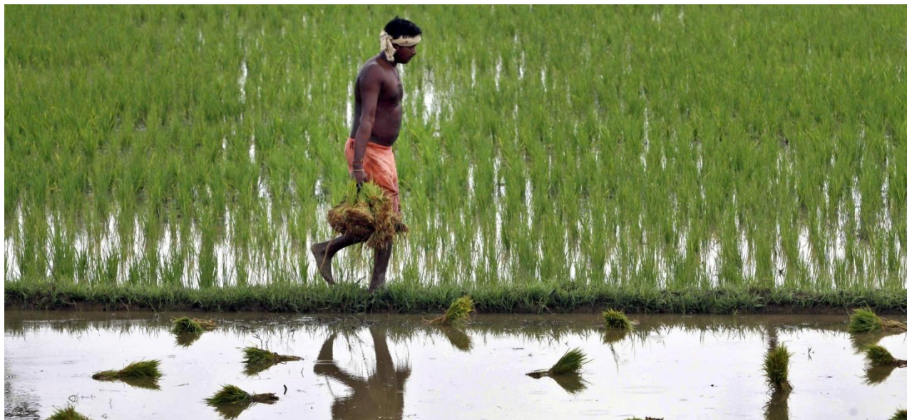
Arroz inundado en Orissa: el tamaño promedio de las fincas en la India se redujo más o menos a la mitad entre 1971 y 2006, duplicando el número de fincas que miden menos de dos hectáreas.

Esta visión distorsionada no cambia significativamente de país en país. Sin embargo, cuando hay datos más específicos, emerge un cuadro totalmente diferente. Las últimas cifras publicadas del censo agropecuario en El Salvador indican que las mujeres son sólo el 13% de los “productores”