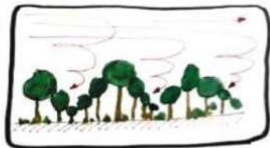
Patró condensador centrípet