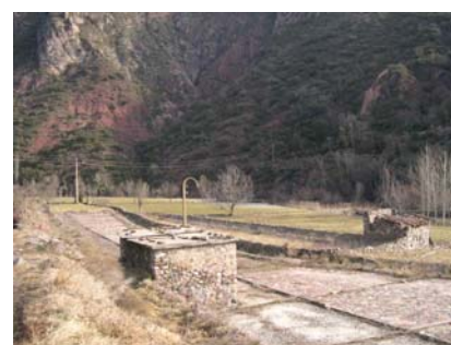
Viver de Gerri de la Sal

Com a mínim es suggereix de sembrar 12 individus per varietat si vol que sigui representatiu, i de les espècies al·lògames és recomanable guardar llavor de 30 individus diferents.