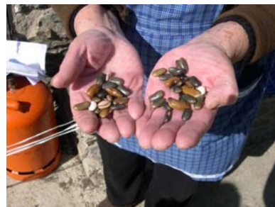
Diferents varietats de fesol d'emparrar. Pepita, Casa Besolí, Àreu