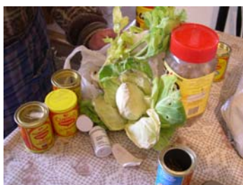
Pots de llavors

All (vermell i blanc), api (verd, mureno i sense nom), carbassa (cabell d'àngel, pasteque, rabequet, rabequet xica, de concurs, groga, verda), carbassó (sense nom i de córrer), ceba dolça, clavellines vermelles, col (comú, de ruc), enciam (negre, verd, mureno, verd llarg o carxofet), escarola (doble de verano, semblant cabell d'àngel), fava, fesol o mongeta (perona, afartapobres, mantega, mata baixa, tavella, quarantens, redó, emparrador, de mongeta, varis sense nom, negre, marronet, del cuc, del tros, tavella redona, baixa de l'hort, vells, roní, procedent del pont de montanyana, roi, avellaneta, de França), pèsol (nanu o gran), remolatxa (comú farratgera), tomàquet (de molt bona mena, de tot l'any, de guardar, palosanto, popa de vaca, normal, llargueta, rodona, rosa).