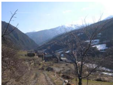
Vistes d'hortos d'Araós