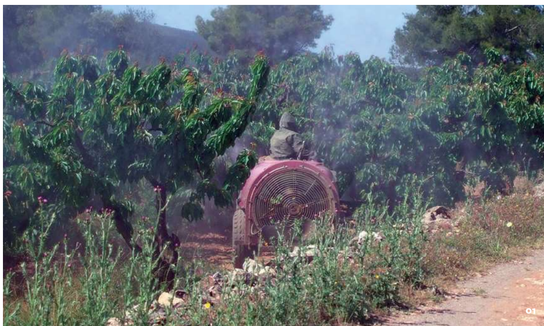
01. Atomitzador en funcionament.

Arran de la normativa europea sobre Ús sostenible de fitosanitaris ja trasposada a Espanya 5 , a partir del dia 26 de novembre de 2015 les persones que vulguin comprar i/o utilitzar un producte